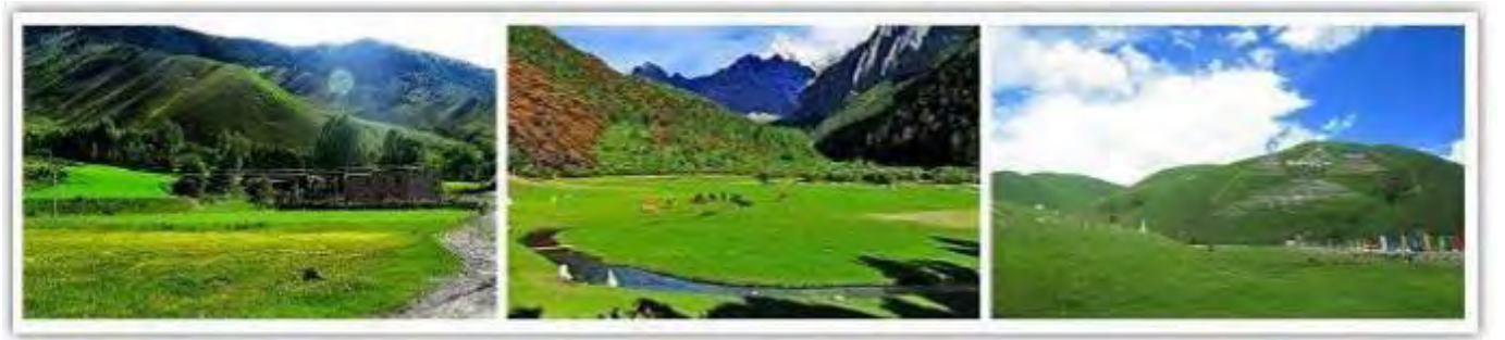
【海子山自然景區】青藏高原最大的古冰體遺跡，以“稻城古冰帽”著稱於世。