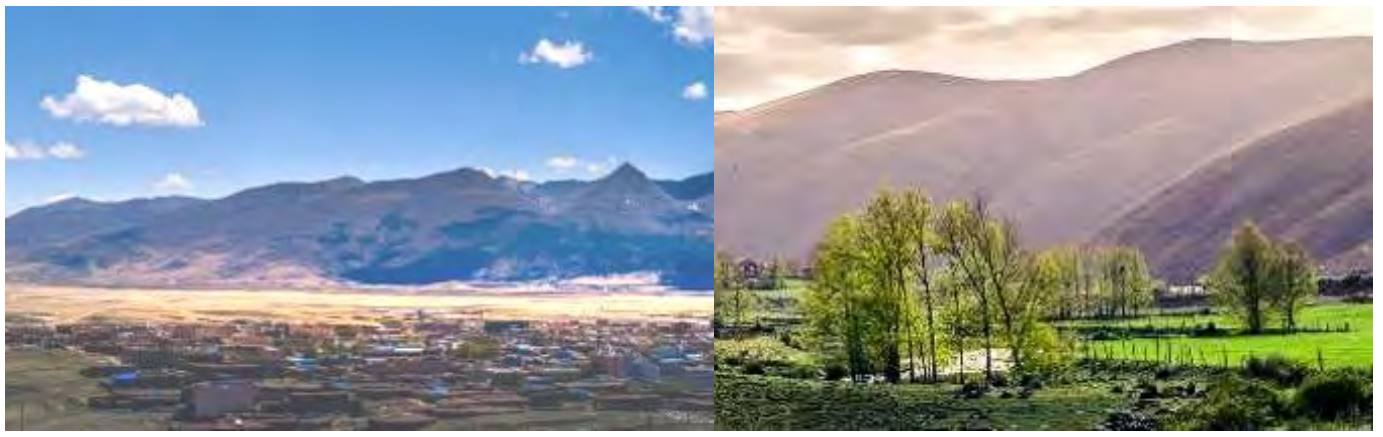
【新都橋】令人神往的“光與影的世界”、“攝影家的天堂”。