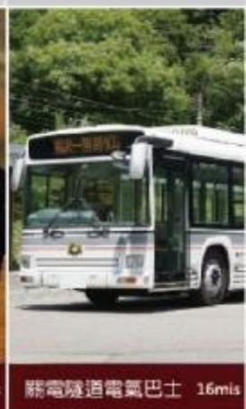
勝電隧道電氣巴士 16m/s