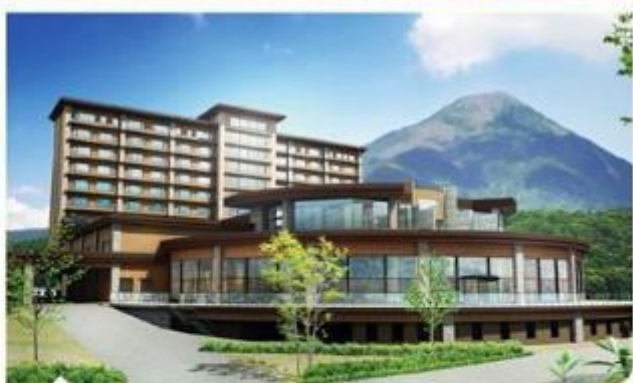
白樺度假村池之平飯店