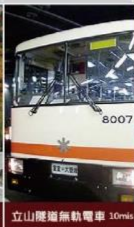
立山隧道無軌電車 10m/s