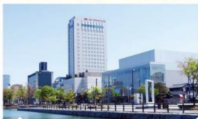
富山全日空皇冠假日酒店