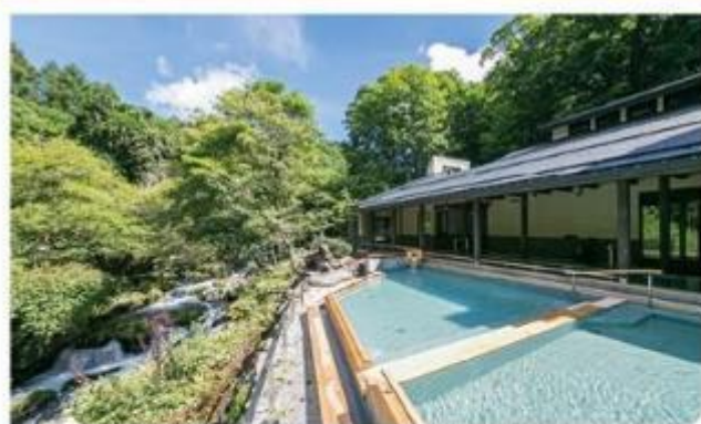
蓼科大酒店瀧之湯