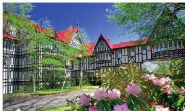
輕井澤GREEN PLAZA 飯店