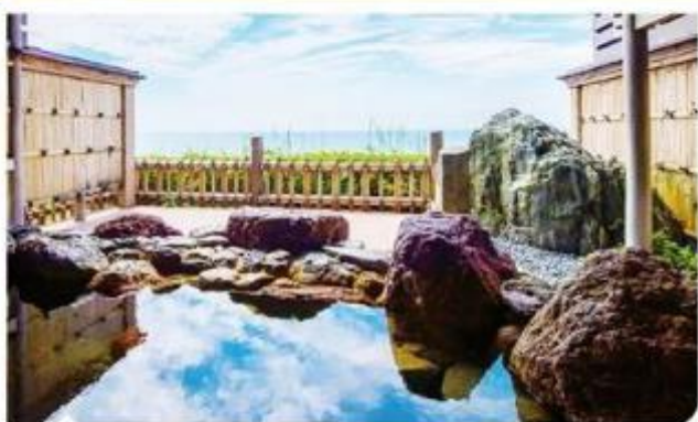
元湯 磯波風 溫泉飯店 露天風呂