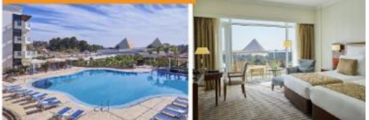
Cairo Pyramids Hotel