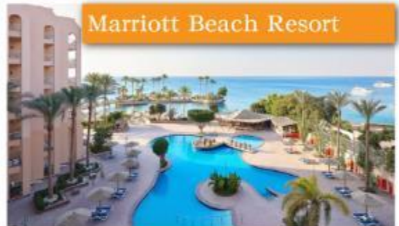
Marriott Beach Resort

Pharaoh Azur Resort 或Pyramisa Sahl Hasheesh或Marriott Beach Resort或Amc Royal Hotel 或 Jasmine Palace Resort或同級