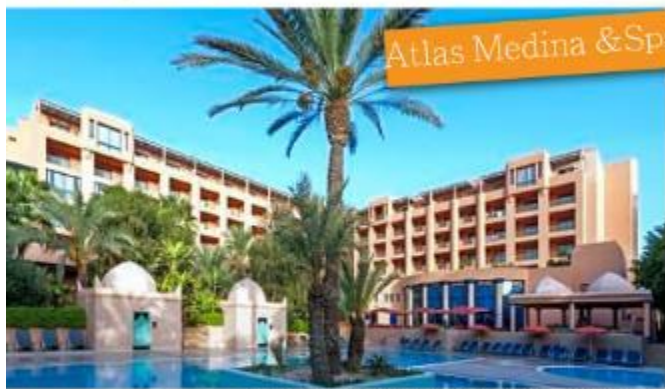
Atlas Medina & Spa