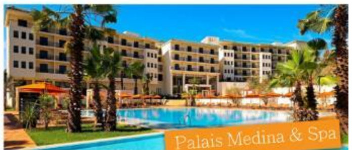
Palais Medina & Spa