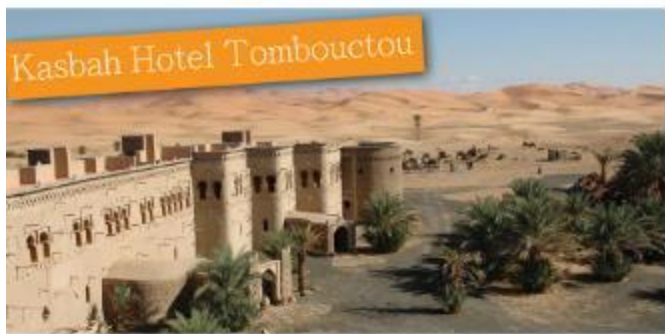
Kasbah Hotel Tombouctou