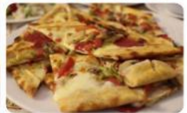
以上圖片僅供參考