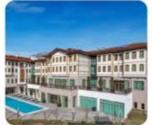
以上圖片僅供參考