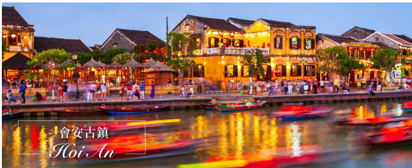
會安古鎮 Hoi An

會安生態之旅，在這裡您可以親身體驗划著奇怪而獨特越南桶船（竹籃船）並參觀桶船秀,（食尚玩 家也曾介紹“桶船秀”表演），如置身於熱帶雨林神秘的亞馬遜河中，穿越原始自然生態風光及體 驗釣螃蟹樂趣，豐富的熱帶生態之旅，等您來探索！