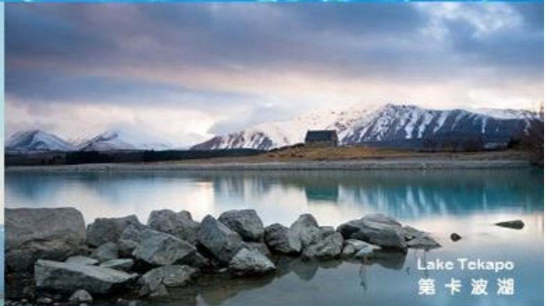
Lake Tekapo 第卡波湖

海拔3,764公尺的庫克山，被稱為「南阿爾卑斯山」，附近環繞著塔斯曼山等18個3,000公尺以上的高山。在國家公園區內有兩座美麗的冰河湖，在壯麗山景和湖景的襯托下交織出不凡的美景，如同置身風景畫中，是南島必遊景點。