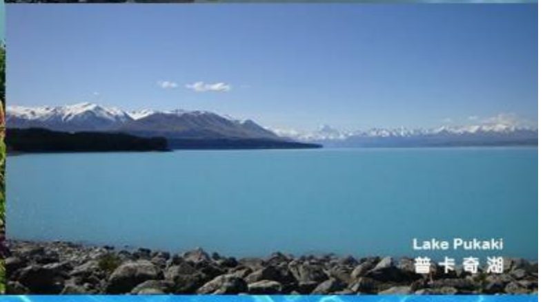
Lake Pukaki 普卡奇湖