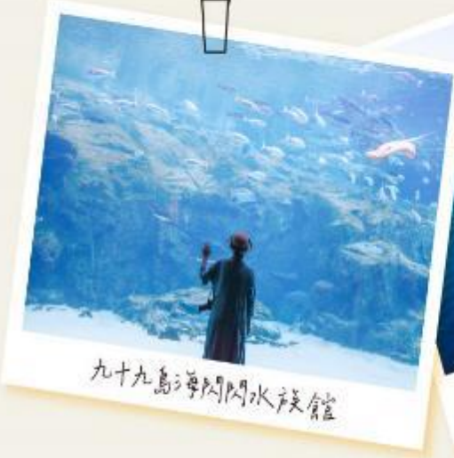
九十九島海閃閃水族館