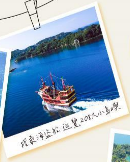
搭乘海盜船巡覽208大小島

位於日本九州長崎縣佐世保港外的「九十九島」地區有著超過200座小島，在這裡可以搭乘遊覽船巡航、還可眺望絕景的展望台「展海峰」等必訪景點與體驗活動！水族館可欣賞各式海洋生物，包括展現表演技巧的海豚、綠蠟龜以及成群悠游的沙丁魚等，非常適合全家同遊！