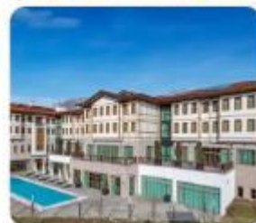
以上圖片僅供參考