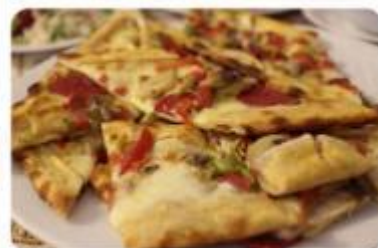
以上圖片僅供參考