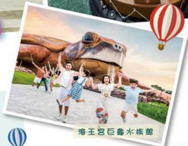
海王宮巨龜水族館