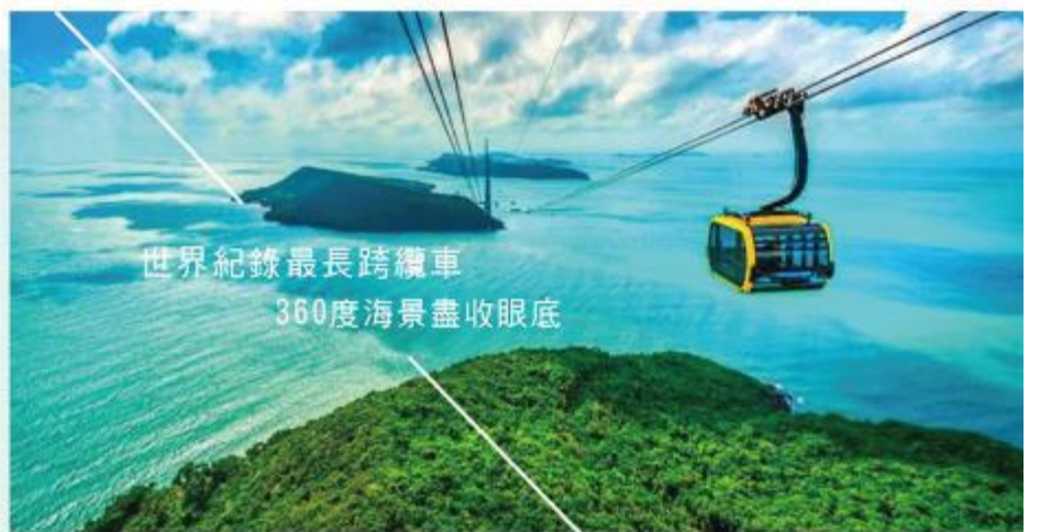
世界紀錄最長跨纜車 360度海景盡收眼底

目前是世界最長的海上跨海纜車，該纜車系統將用以連接主島與其南部離島；與渡船相比，交通時間減少了一大半。海纜線路全長約8公里，一端在安提鎮 (AnTh i)，另一端在富國島最大離島 - H nTh m島，總長度7899公尺，纜車系統最高速度可達到每秒8.5米，從開始到最後一站的總時間約20分鐘，每個車廂最多可坐30人。在纜車上看到的是全面美麗的海景，腳下是天然的富國島蔚藍的大海、綠色的海島、各種大小不一的小島、黃金沙灘、小漁村、海灣漂浮著各種顏色的小漁船，從空中看過去非常壯觀，不管是看日出還是日落，這裡都是最美的角度。在纜車上看到的是360度的海景。