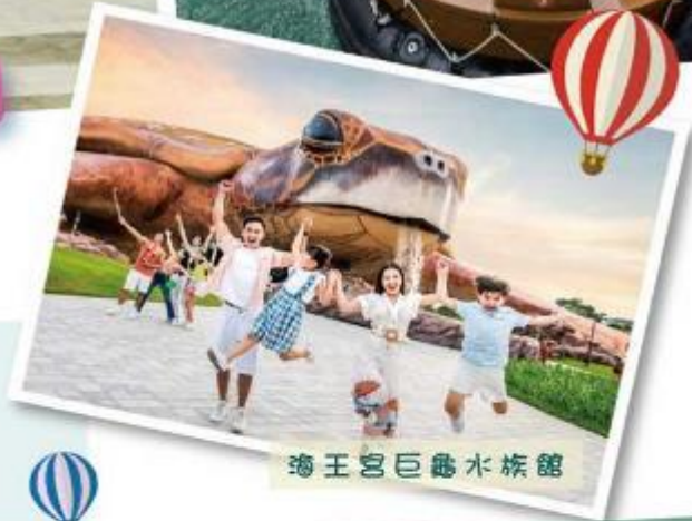
海王宮巨龜水族館