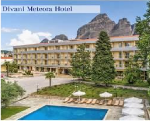
Divani Meteora Hotel