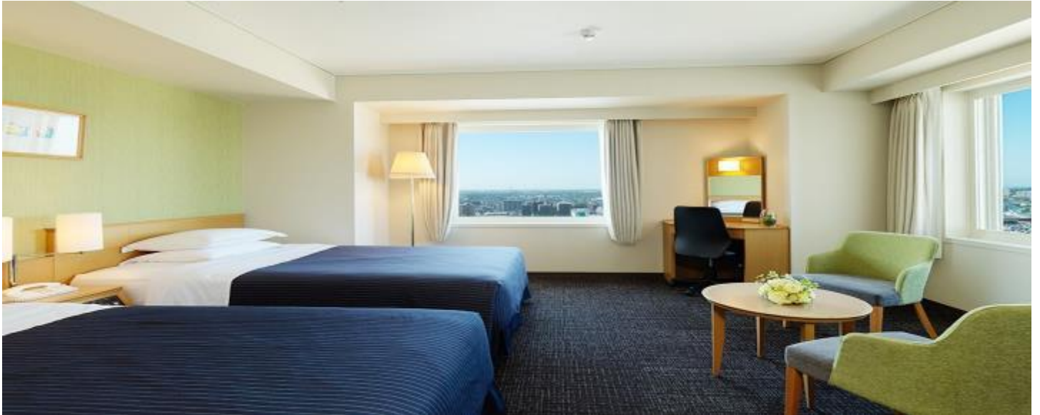
☆行程特色七：入住三大溫泉區：登別溫泉/洞爺湖溫泉飯店/湯之川溫泉或大沼溫泉