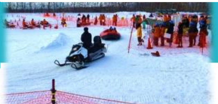
スノーラフティング (1回:約1.5~2分)