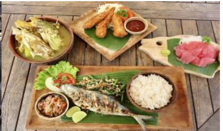
(以上餐食食材內容將依季節時令做調整,以餐廳飯店現場提供為準)