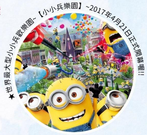
★世界最大小小兵歡樂園~【小小兵樂園】~2017年4月21日正式開幕!!