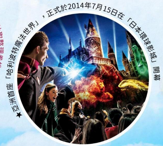
★亞洲首座「哈利波特魔法世界」，正式於2014年7月15日在「日本環球影城」開幕