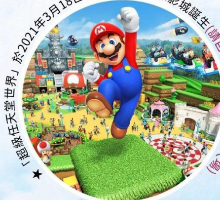
★「超級任天堂世界」於2021年3月18日在日本大阪環球影城誕生(請自行抽取整理券排隊入場)