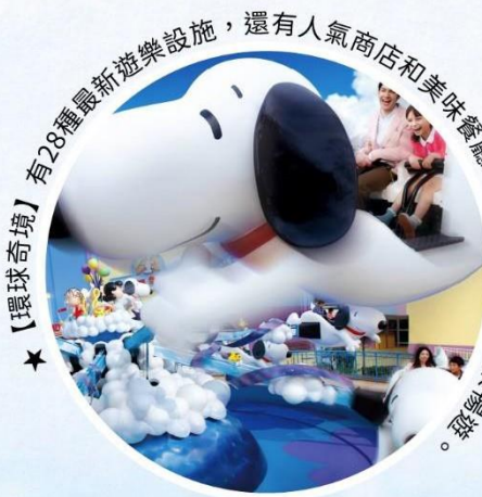
★【環球奇境】有28種最新遊樂設施，還有人氣商店和美味餐廳~歡迎您全家一同來暢遊。

※【特別說明】日本環球影城自西元2009年1月2日影城營業日起，持票進入影城後，不可中途離場後再入場(不可重複入場)。