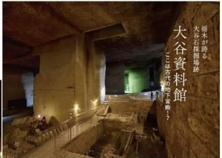
位於宇都宮市街西北約7公里位置的大谷地區，產出的大谷石。為著名的建築物、倉庫藏、民家藏等，其用途極度很廣。在高度成長期需要大力的延伸，在大谷地區採掘盛行。在採掘場形成巨大的地下空間。同時，於現在跡地能見到古代遺跡那樣的趣味。成為飄浮著幻想氣氛的獨特場所之地下空間。宇都宮一個魅力之物大谷石的地下世界，年均溫維持在攝氏九度。