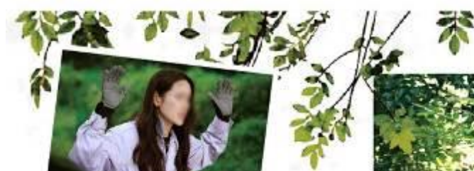
韓劇《愛的迫降》孫藝珍迫降到的森林之地