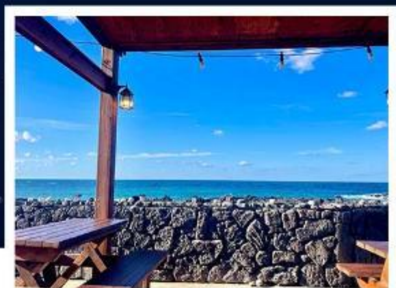
超級海景霸氣龍蝦之家 (兩人一隻+炒飯)