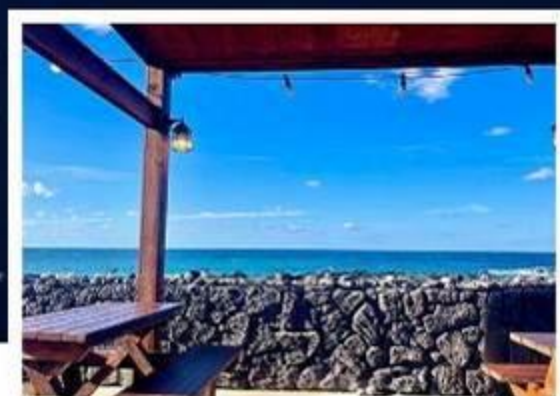
超級海景霸氣龍蝦之家 (兩人一隻+炒飯)