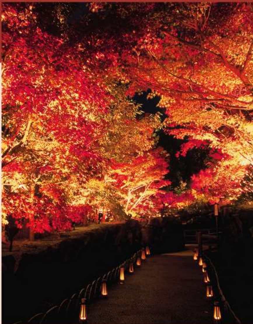
(由志園 夜間鑑賞) 開催期間/11月中旬~12月上旬

山陰地區最大規模池泉回遊式庭園。 紅葉點燈，邀您步入與白晝截然不同、 唯美夢幻的深夜幻境。