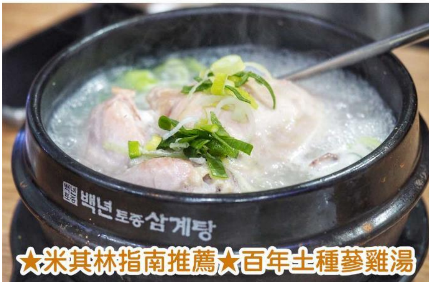
★米其林指南推薦★百年土種蔘雞湯