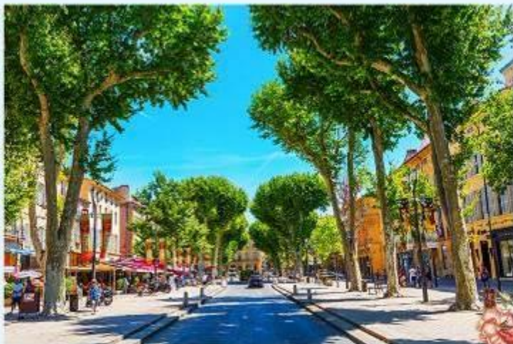
Aix en Provence