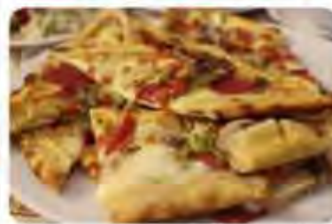
以上圖片僅供參考