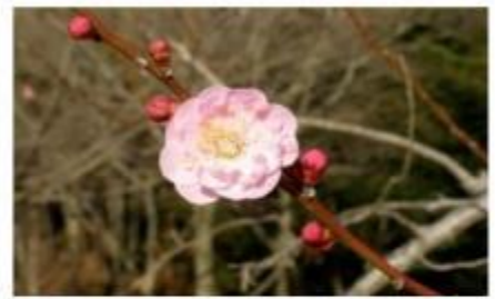
江南所無 (こうなんしょむ)

遅咲きの時期の楽しみ方は“送梅”。遅く咲き始めた梅の香りを楽しみながら、去りゆく梅の季節を見送ります。 代表的な遅咲き品種は「白加賀」「春日野」「江南所無」などです。